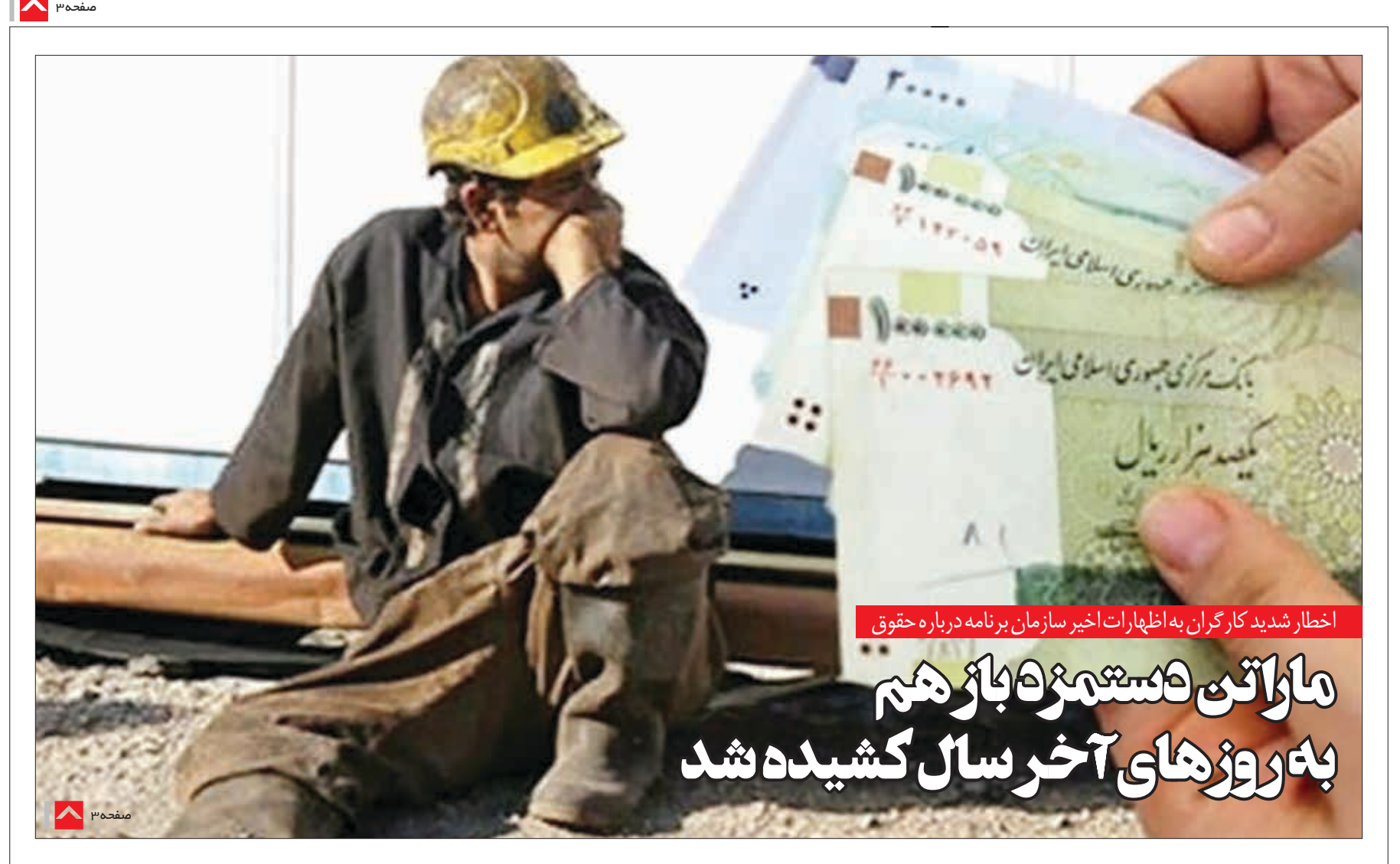
اخطار شدید کارگران به اظهارات اخیر سازمان برنامه درباره حقوق