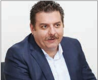
نایب رئیس اتحادیه نمایشگاهداران و فروشندگان خودرو: