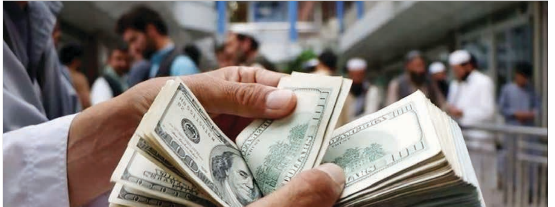
پیش بینی کارشناسان از آینده قیمت دلار

دلار در سال ۱۴۰۳ تحت تاثیر چه عواملی است؟