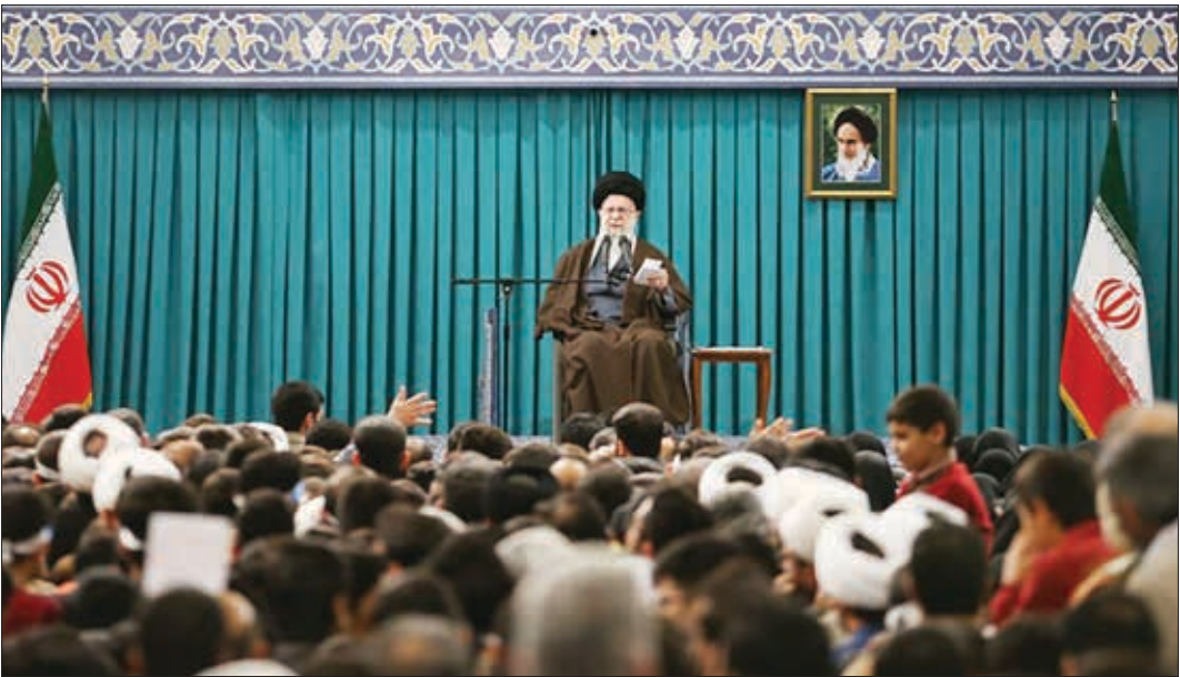
رهبر انقلاب اسلامی در جریان دیدار با اعضای هیئت دولت

گفتند: بدخواهان ماه‌هاست که در رادیو تلویزیون‌ها و در فضای مجازی سعی می‌کنند مردم را از حضور و اثربخشی انتخابات مایوس کنند.