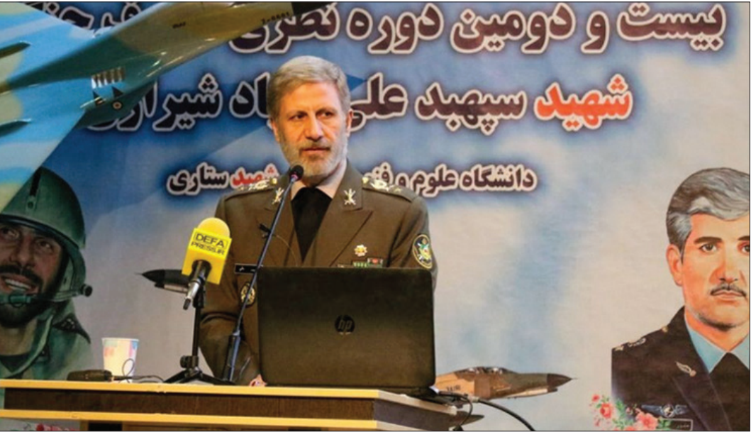
شعار «دولت و دین» در تظاهرات