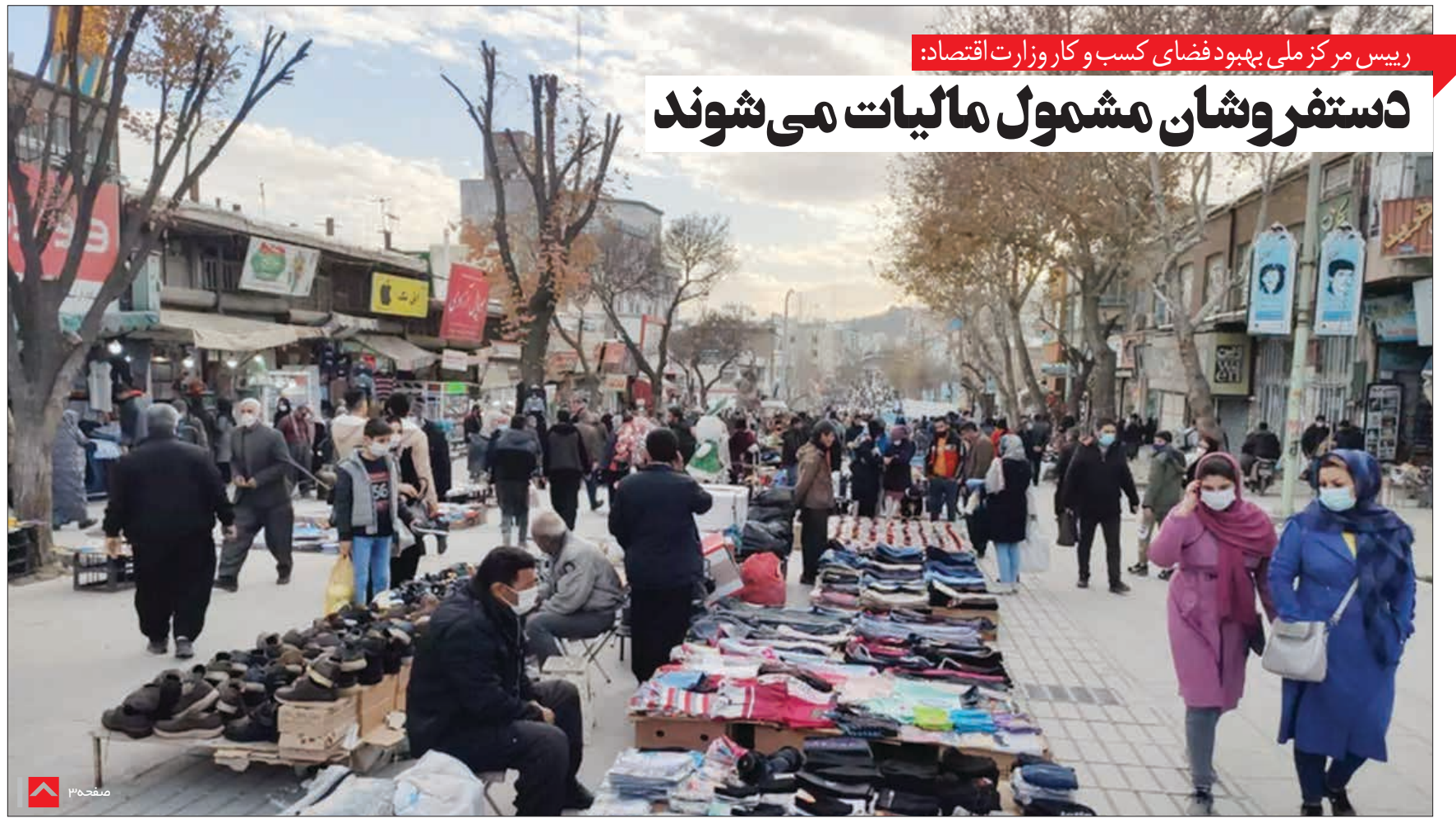
رئیس مرکز ملی بهبود فضای کسب و کار وزارت اقتصاد: