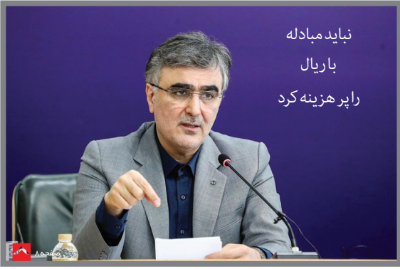
نیاید مبادله باریال راپر هزینه کرد

کدام شرکت گارانتی آیفون های کوروش کمپانی را برعهده داشت؟