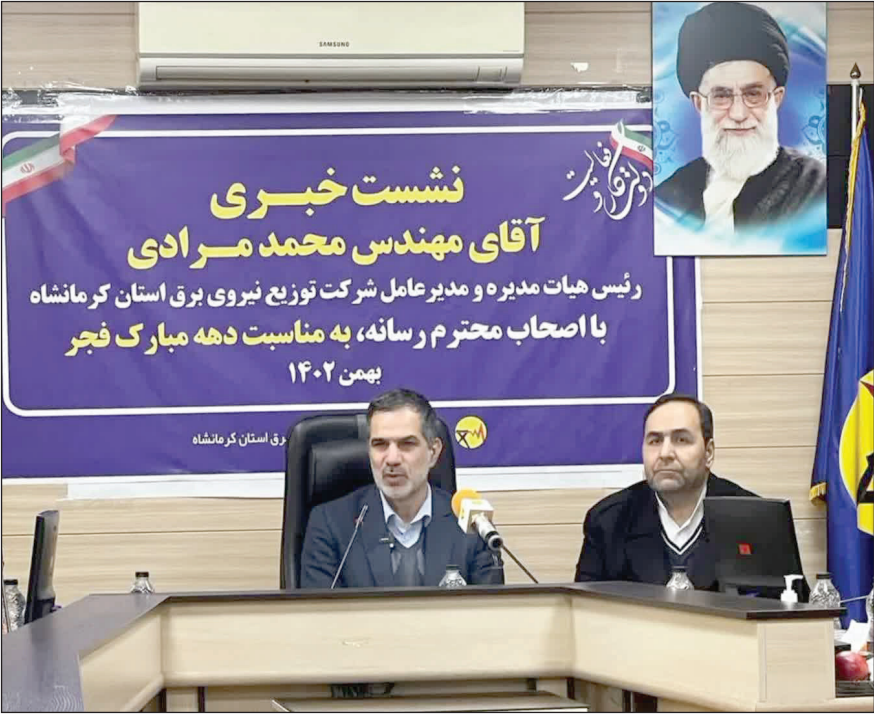
رونق استان کرمانشاه

بخش روشنایی معابر تعویض و نصب شده است و در حال حاضر در کل استان بیش از ۲۰۴ هزار چراغ روشنایی معابر در استان نصب شده وجود دارد که بصورت دوره ای اصلاح و بهینه سازی می شوند. وی تأکید داشت: تعداد روستاهای برق دار شده