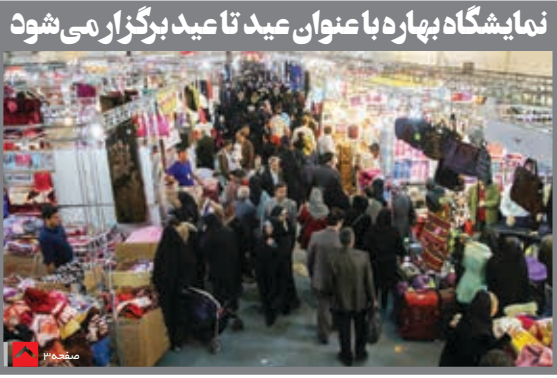
نمایشگاه بهار با عنوان عید تا عید برگزار می شود

بخشی خصوصی می تواند کشور را به رشد ۸ درصد برساند