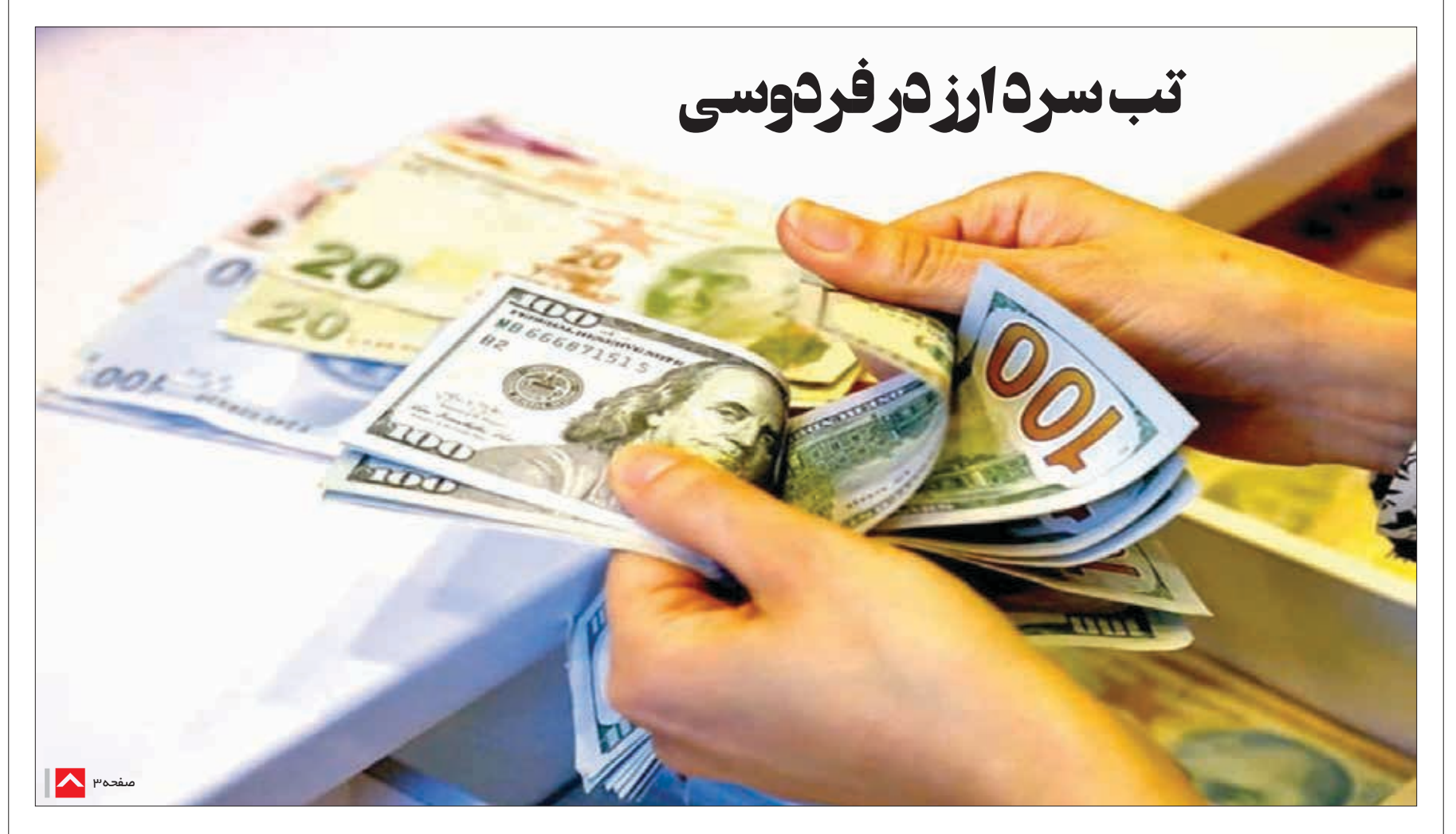
تب سرد ارز در فردوسی