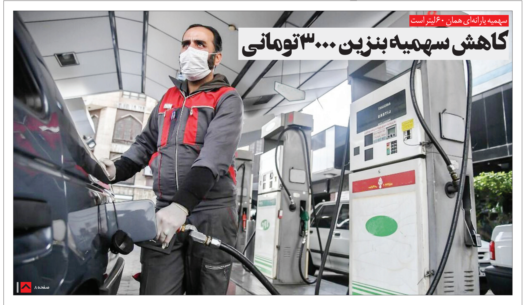
سهمیه یارانه‌ای همان ۶۰ لیتر است