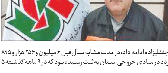
در ۹ ماه گذشته صورت گرفت:

نخفقلیزاده ادامه داد: در مدت مشابه سال قبل ۶ میلیون و ۲۵۶ هزار و ۸۹۵ تردد در مبادی خروجی استان به ثبت رسیده بود که در ۹ ماه گذشته ۵