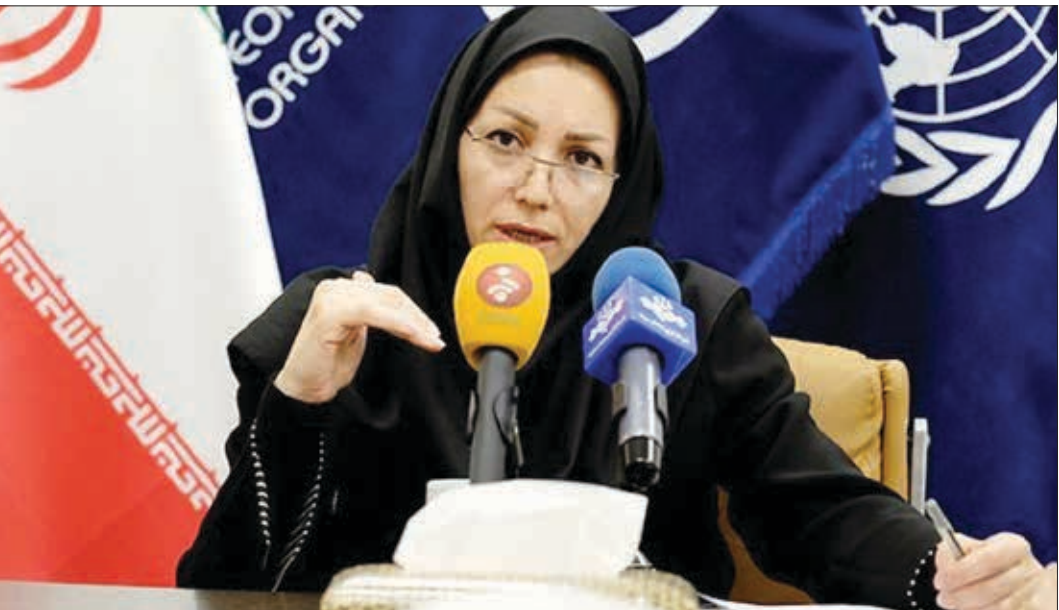
رییس سازمان هواشناسی در مراسم رونمایی