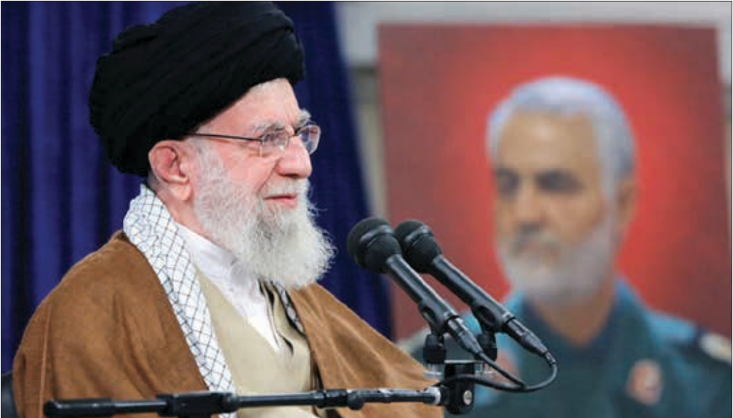
رهبر معظم انقلاب اسلامی

است که خون شهیدان همه‌ای استان‌های کشور روی خاک خوزستان ریخته شده است؛ این یعنی خوزستان نماد همدلی و همبستگی همه‌ای ملت ایران است و از همه‌ی نقاط کشور جوان‌ها، پیش‌قراولان، فداکاران آمدند در آنجا با ایمان‌شان، با انگیزه‌شان در آنجا جنگیدند و جان خودشان را در راه اسلام و ایران و جمهوری اسلامی فدا کردند؛ خوزستان نماد همبستگی ملت ایران شد.