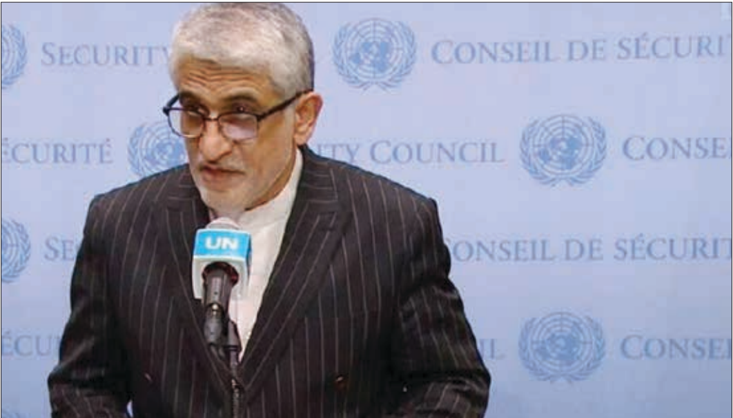
اسراییل در جریان جنگ غزه