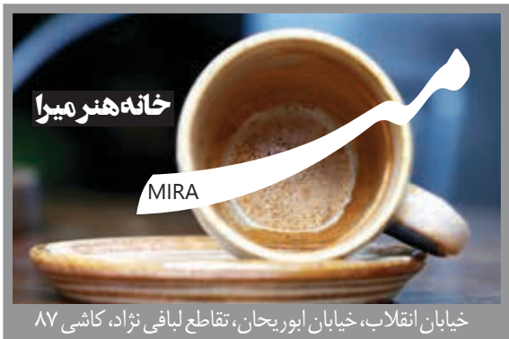
خیابان انقلاب، خیابان ایوریجان، تقاطع لیافی نژاد، کاشی ۸۷

از زمان ابلاغ قانون واردات خودرو تا امروز دلار ۲۰ هزار تومان گران شد اما وعده‌ها اجرا نشد