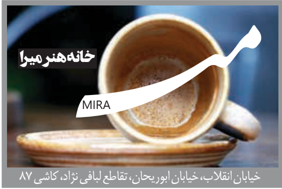
خیابان انقلاب، خیابان ایوریجان، تقاطع لیافی نژاد، کاشی ۸۷

بهداری جهرمی در نشست خبری: دولت تلاش کرد تا بودجه را واقعی تنظیم کند