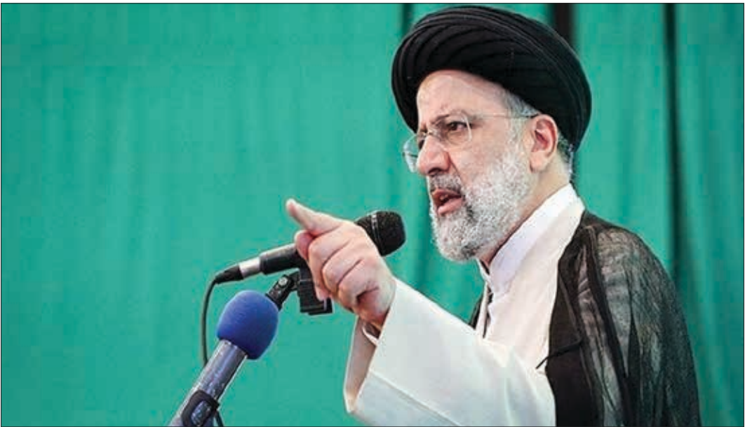
رئیس‌جمهور ایران، سید ابراهیم رئیسی

وی با اشاره به موضوع آمایش سرزمینی اظهار کرد: معیار آمایش سرزمینی به عنوان یک نمونه است که ثروت‌ها را بر اساس آمایش سرزمینی در کشور توزیع کنیم؛ البته این موضوع تنها ملاک نیست؛ اما یکی از معیارهایی است که می‌تواند موجب اجرا عدالت شود. رئیسی ادامه داد: ما در تمام امور تجربه داریم اما هر جا که پای مردم به میان آمده، موفقیت را داشتیم و هر جا که دولت‌ها مردم را به حساب نیاورده و مردم‌پایه عمل نشده، کار دچار مشکل شده‌است.