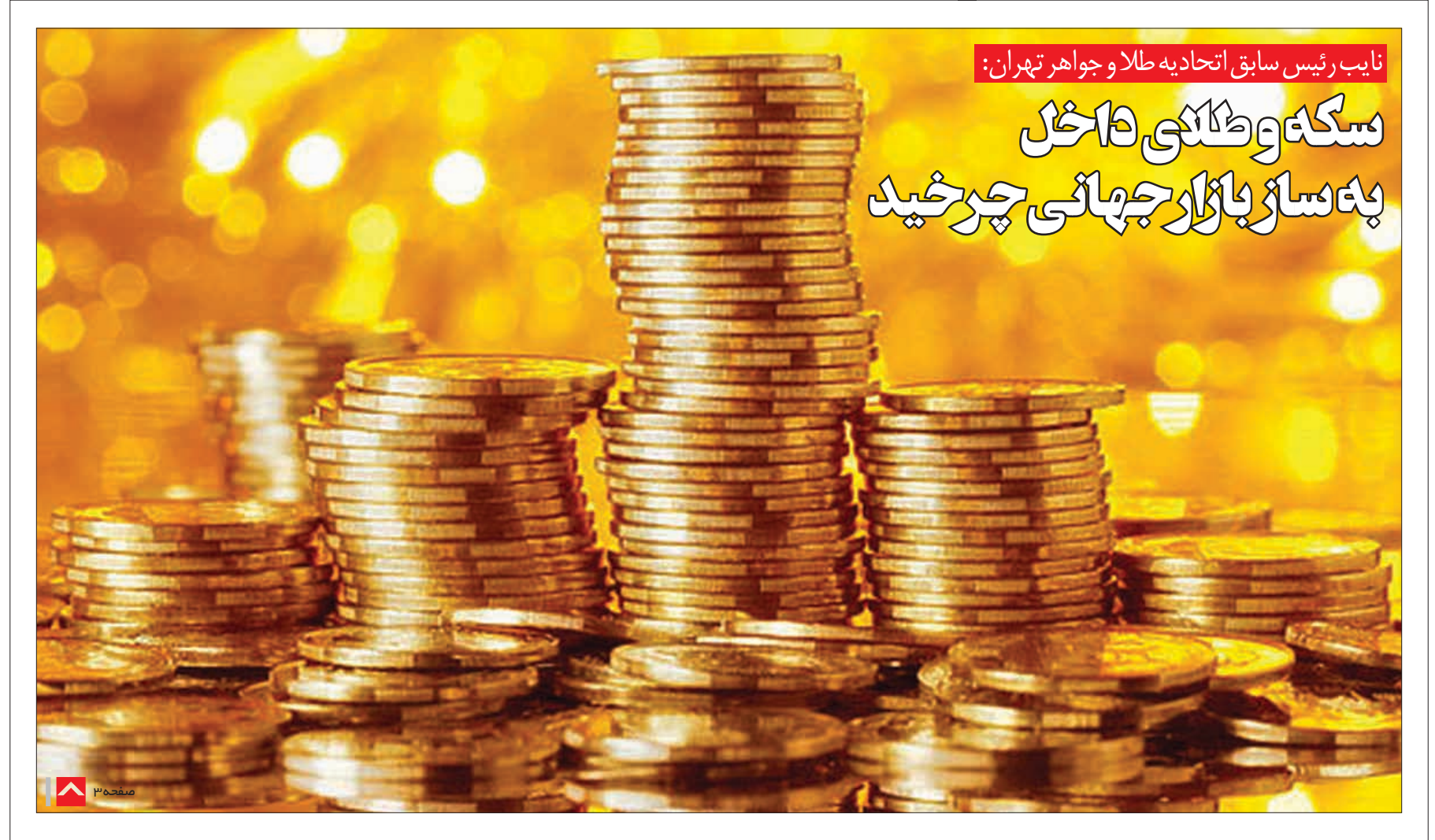
نایب رئیس سابق اتحادیه طلا و جواهر تهران:

سخت‌گیری شورای رقابت اظهار داشت: تاکنون ۱۴ صندوق بازنشستگی ۲۶ نهاد عمومی غیردولتی و همه شهرداری‌های کشور با تمرکز بر ۹ شهرداری کلان شهر مشمول این ماده تشخیص داده شده‌اند. وی از حبس و جریمه نقدی بر اساس ماده ۷۲ و بند ۱ ماده ۷۹ قانون مزبور به عنوان ضمانت اجرایی تشخیص شورا در این خصوص یاد کرد و اظهار داشت: رویه رسیدگی به اتهامات این ۱۳ نهاد همچنان در جریان است که البته در برخی موارد احکامی مانند صدور قرار منع تعقیب، اثبات اتهام، و ادامه رسیدگی صادر شده است که البته مانع انجام ادامه وظایف شورا در مطالبه جرم نیست. وی اسامی این نهادها را فعلاً اعلام نکرد و اظهار داشت: به دلیل پیچیدگی‌های موجود و ضرورت دقت و اثرگذاری تصمیمات بر توسعه جامعه و رفاه مردم باید به دستگاه قضا فرصت داد تا بیش از پیش مطالبه جرم حق مردم باشد.