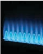
همراه بوده به‌طوری که

به عنوان پاداش صرفه‌جویی دریافت می‌کنند و در قبض خود مشاهده خواهند کرد؛ مثلاً اگر یک مشترک در تهران، یک بخاری منزل خود را که همواره روشن است به مدت ۴ ساعت در روز خاموش کند، بی‌شک شامل این پاداش می‌شود.