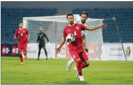
هم گفتم که اگر نباشم برای موفقیت تیم ملی دعایم کنم.

«با وجود تهیه‌ایی مثل ژاپن و کره جنوبی، آیا برای قهرمانی در جام ملت‌های آسیا شانس‌ی خواهیم داشت؟»، وی در پاسخ به این پرسش گفت: همه ما می‌دانیم که با این دو کشور از لحاظ امکانات، مسائل سخت‌افزاری، برنامه‌ریزی و خیلی چیزهای دیگر چه تفاوتی داریم. ما در این فوتبال مشکل زمین تمرین و استادیوم داریم که مسائلی ابتدایی در فوتبال هستند و این دغدغه‌ها را ژاپن و کره جنوبی ندارند. در این سال‌ها دیدید که تیم‌های عربی چگونه پیشرفت کردند، ولی ما در جا زدیم. این را فراموش نکنید که ما تیم ملی ایران هستیم و هرگز تسلیم نمی‌شویم.