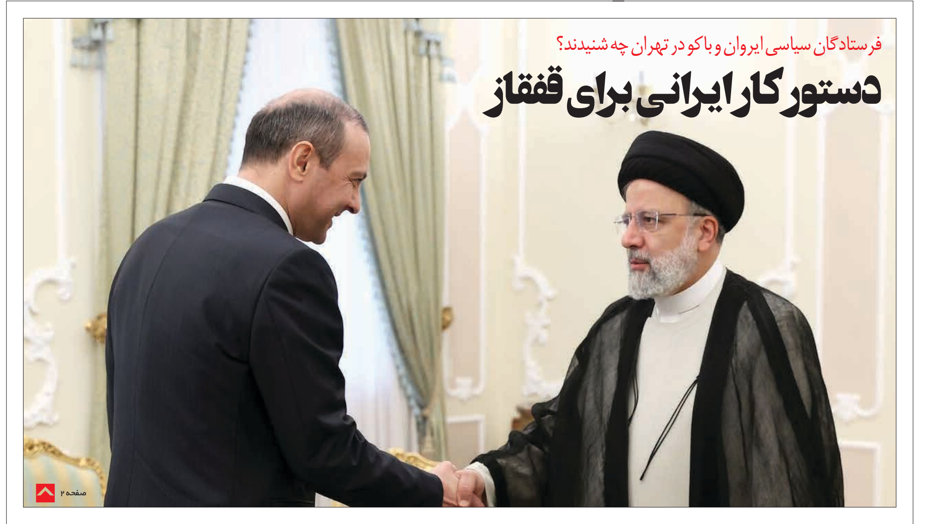
فرستادگان سیاسی ایران و باکو در تهران چه شنیدند؟

حذف کالاها از بورس یعنی حذف شفافیت قائم مقام سابق وزیر صمت در ادامه در خصوص ورود سیمان به بورس کالا گفت: وقتی در دولت می گوئیم سیستم قیمت گذاری دستوری و فرآیند کواله ای نباشد، خوب نقطه مقابل این رویه چیست؟ قطعاً بورس کالا است. وی ادامه داد: راه جلوگیری از رانت و فساد در مبادلات کالایی، بورس کالا است که محصول در یک مکانیزم شفاف، کاملاً روشن، مستند و قابل حسابرسی عرضه و معامله می شود. وی با تأکید بر این نکته که عرضه در بورس سبب حذف تقاضای کاذب و کشف واقعی قیمت ها می شود اظهار کرد: در چند سال و چند دهه گذشته دلالان از روش های غیر شفاف و رانتی بهره برده اند در حالی که ایس روش ها به دلیل شفافیت در بورس، منتفی می شود. مفتاح ادامه داد: در تمام دنیا این مکانیزم برای عرضه محصولات استفاده می شود. ما تنها کشوری نیستیم که محصولات اساسی را تولید می کنیم و سایر کشورهای تولید کننده نیز از این مکانیزم استفاده می کنند و حتی در فرآیندهای صادراتی خود نیز از بورس کمک می گیرند. به گفته مفتاح، بورس یک رابطه بسیار شفاف میان تولیدکننده، مصرف کننده و در یک کلام نظام توزیع است. وی خاطر نشان کرد: اتفاقاً اگر بنای دولت تأمین سیمان و فولاد برای پروژه های بزرگ است، بهترین و شفاف ترین راه آن بورس کالا است چرا که کمترین امکان فساد و رانت در این بستر وجود ندارد. قائم مقام سابق وزیر صمت در پایان مخالفت ها با عرضه سیمان و فولاد در بورس کالا و مقصر جلوه دادن بورس در گرانی ها را عدم آشنایی با فرآیندهای بورس عنوان کرد و گفت: این افراد یا آشنا نیستند یا تصمیم خود را گرفته اند که بورس را مقصر جلوه دهند و حالا دنبال دلیل می گردند.