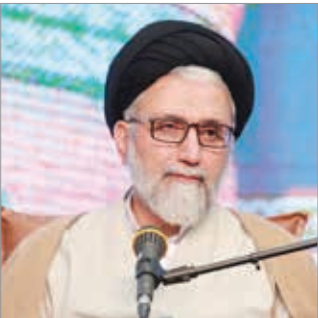
امید به آینده را می‌خواهند.

می‌خواستند ۳۰ کمد به صورت همزمان در تهران منفجر کند که در اطلاعیه وزارت اطلاعات بدان اشاره شد.از جمله می‌خواستند در مسیر راهپیمایی و الباقی را در سایر مکان‌های عمومی منفجر کنند. بسم‌ها زمان‌دار نبود و با موبایل منفجر می‌شد.خطیب افزود: دشمنان در این رابطه به دنبال ایجاد کشته‌سازی بودند و اطلاعاتیه‌هایی نیز آماده کرده‌بودند که در آن آمده بود این کشته‌سازی به‌تلافی کشته‌های اغتشاشات است تا به نظام نسبت دهند.