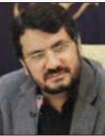
وزیر راه و شهرسازی

وی ادامه داد: صنعت راه آهن یک صنعت ایمن ارزان و صنعت خوب است اما ما محدودیت ناوگان داریم اما خوشبختانه در توسعه شبکه خدمات الکترونیکی و توسعه ناوگان اتفاقات خوب رخ داده است به طوری که داخلی سازی و عمق