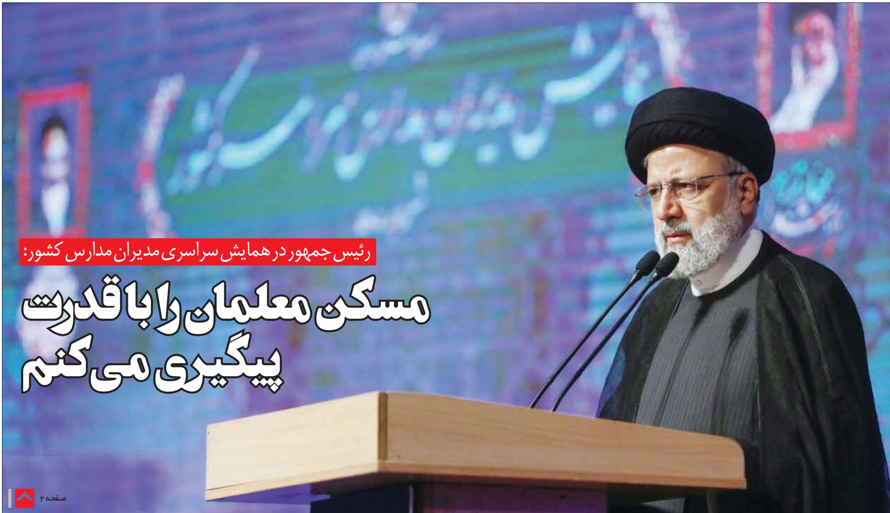
رئیس جمهور در همایش سراسری مدیران مدارس کشور: