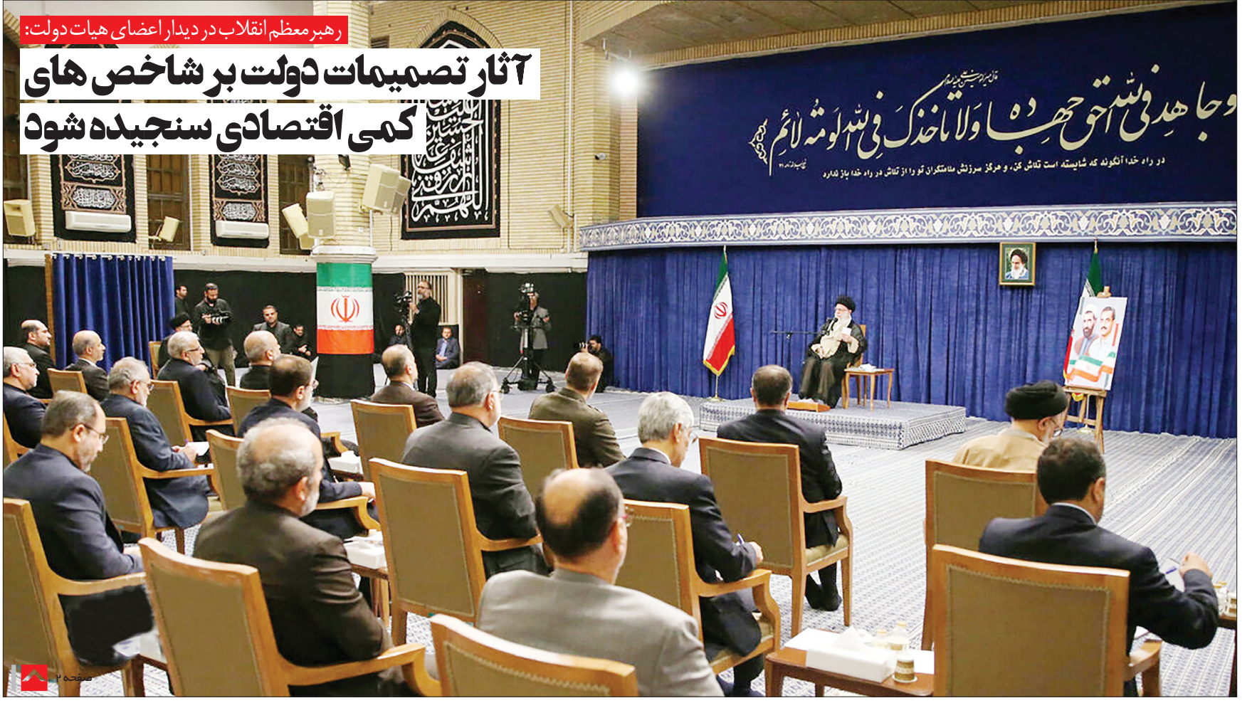
سازمان انرژی اتمی