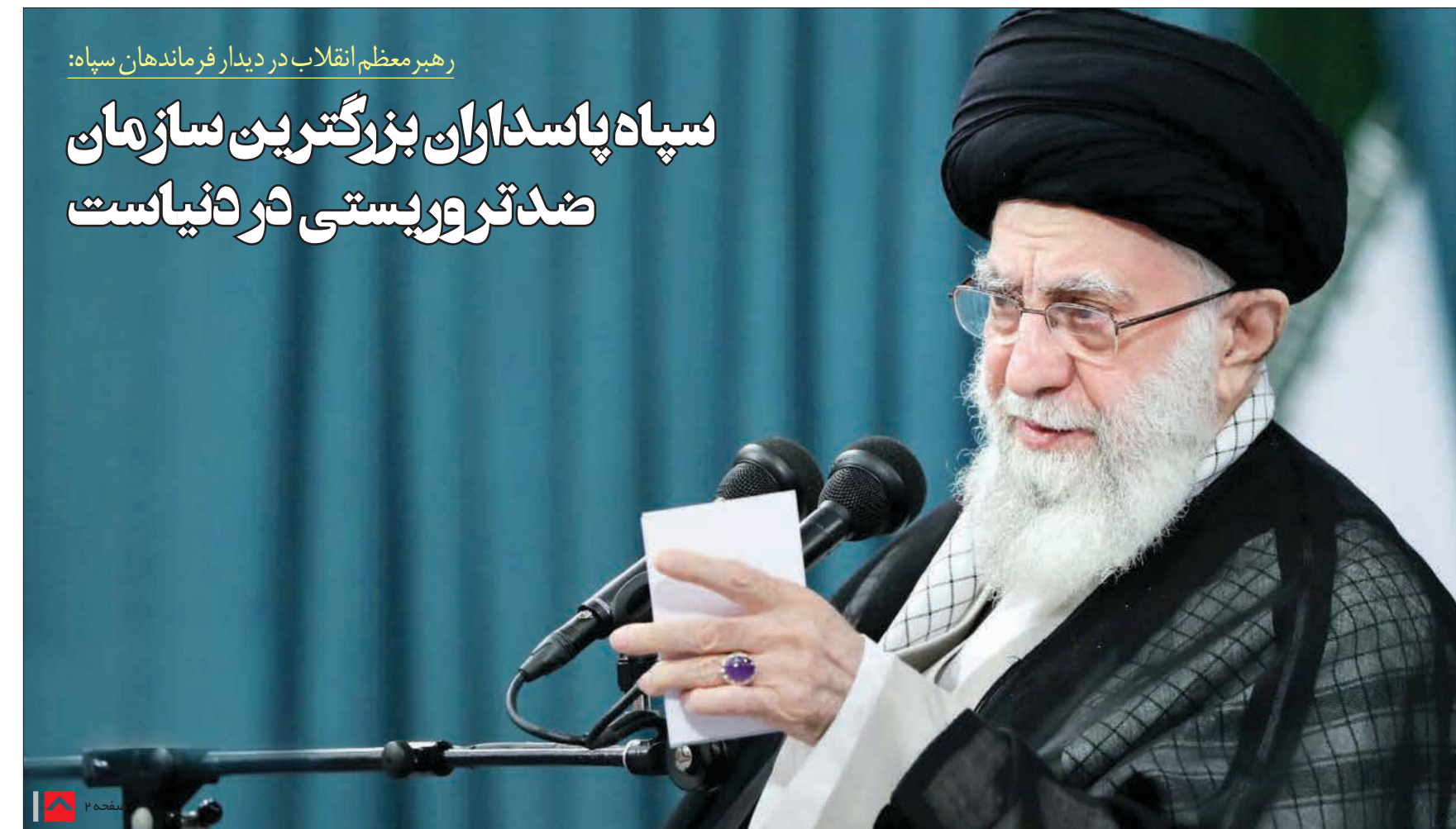
رهبان معظم انقلاب در دیدار فرماندهان سپاه: