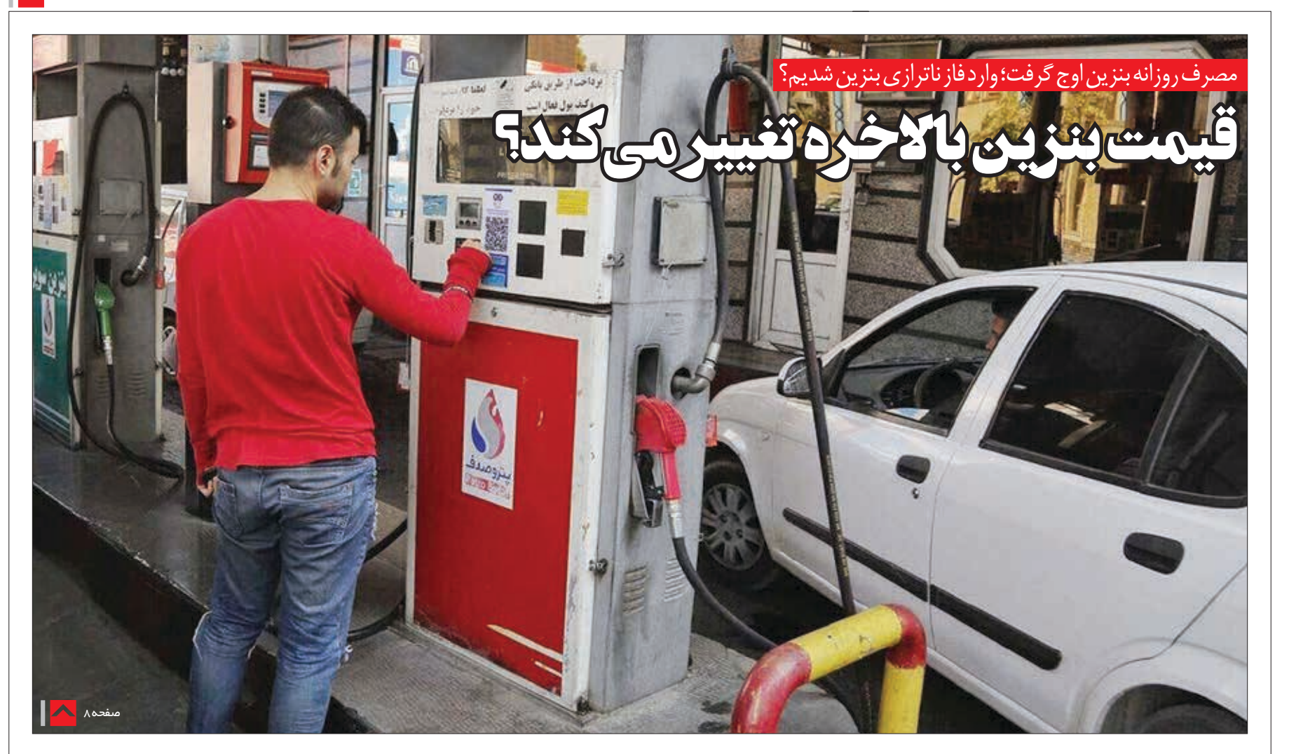
مصرف روزانه بنزین اوج گرفت؛ وارد فاز ناترازی بنزین شدیم؟