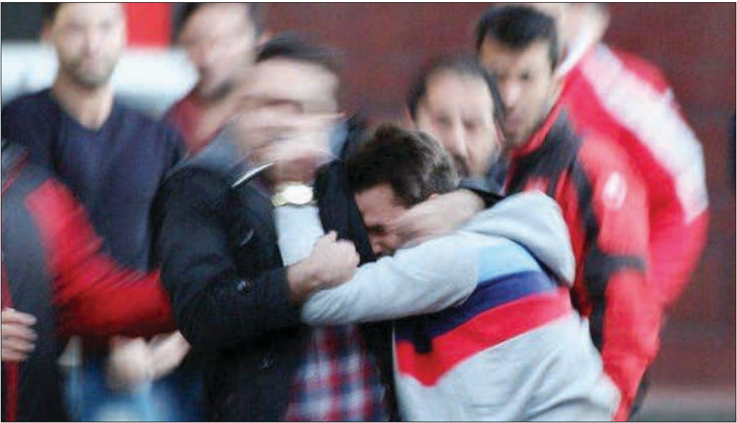
تصادمات خیابانی در تهران

پزشکی قانونی کشور عوامل متعددی موجب افزایش نزاع در فصول گرم سال می‌شود، گرمای هوا، افزایش تردد‌های خیابانی، تنش‌های اقتصادی و اجتماعی و مثل اینکه این موضوع به یک عادت برای رانندگان بی‌اعصاب در گرمای تهران تبدیل شده است و همه انتظار دارند بعد از تصادف شاهد دعوا و نزاع بین رانندگان پیش باشند.