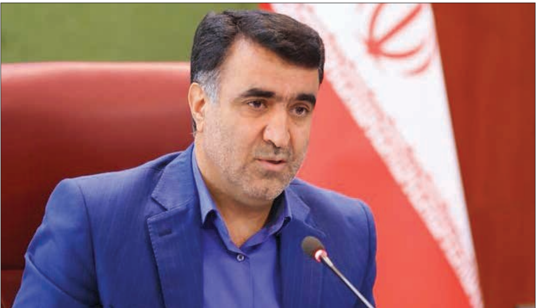
رئیس سازمان حفاظت محیط زیست ایران

ادامه دهیم.سلاجقه با بیان اینکه کشور ما در حوزه سوخت های فسیلی در رده بالای جهان قرار دارد و می بایست از این امکان به نحو مطلوب استفاده کنیم، افزود: از طرفی هم شاخص های محیط زیستی در کشور با جدیت و اهتمام ویژه انجام می‌شود.وی در ادامه و در جریان بازدید از مجموعه پالایشگاه نفت تهران و بهره‌برداری از فاز نخست سیستم تصفیه پساب شهری این مجموعه، با بیان اینکه خط کش‌های دنیا به این سمت و سسو می‌رود که کشورهای واجد سوخت‌های فسیلی را با مشکل مواجه کنند تا نتوانند از این نعمت خدادادی استفاده نمایند، گفت: بر همین اساس می‌تلبد که رویکرد خود را از تأمین انرژی مبتنی بر سوخت واحد تغییر داده و اقدامات‌مان را در راستای چندسوختی