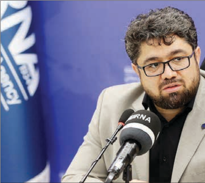
مدیر عامل سازمان تأمین اجتماعی در نشست خبری با خبرنگاران

درصد سهم تعهدات بردند بالا و رقمی که ما قبلاً ۲۳ هزار تومان سهم هر داخ می کردیم در آخرین قرارداد که شد کل قرارداد ۲۰۵ هزار تومان، ما ۱۰۲ هزار ۵۰۰ تومان تقبل کردیم یعنی نسبت به سال قبل رشد ۱۲۰ درصدی در سهم مورد قبول سازمان در منابع داشتیم که بالغ بر ۴ الی ۵ میلیارد تومان هر سال هزینه می کنیم در حوزه مساعدت به بیمه‌های تکمیلی که بخشی از هزینه‌های خدمات درمانی سنگین برای عزیزان بازنشسته کمتر کرد.