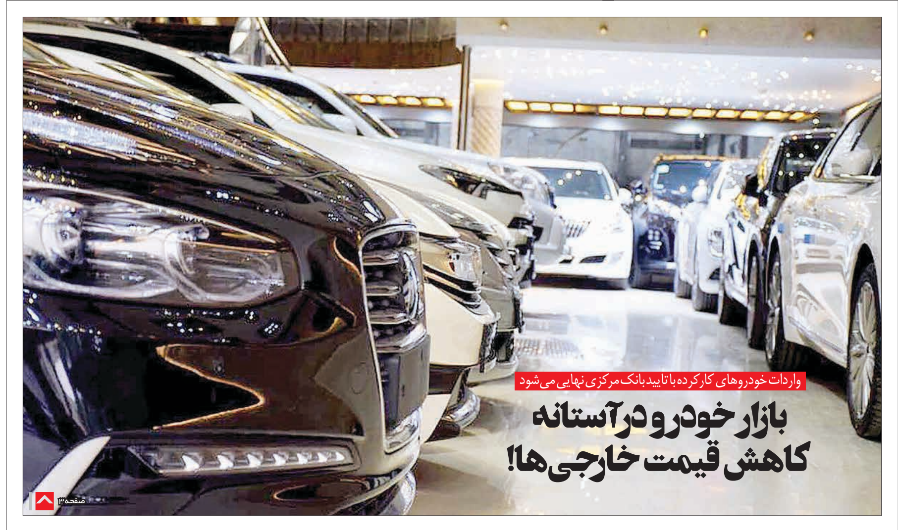
واردات خودروهای کارکرده با تأیید بانک مرکزی نهایی می شود