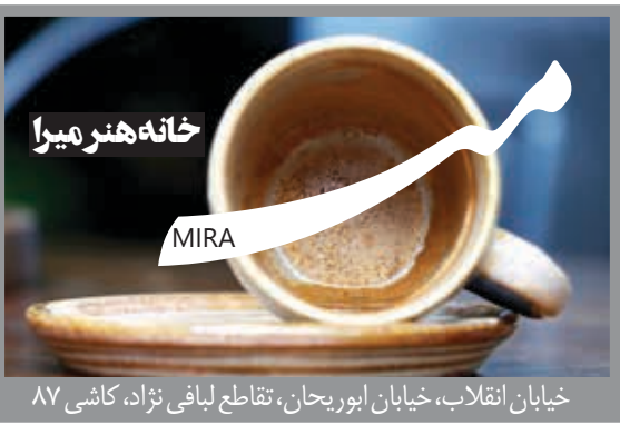
خانه هنر میرا