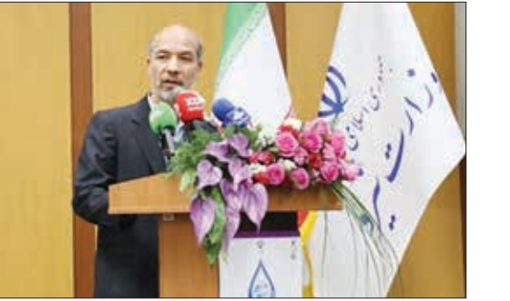
وزیر نیرو در حین افتتاح طرح‌ها و پروژه‌های صنعت آب و برق استان کرمان.

وزیر نیرو واافده کرد: مسیر شرقی برای تأمین آب استان‌های سیستان و بلوچستان، خراسان جنوبی و خراسان رضوی در حال پیشرفت است که این طرح حدود ۱۰ درصد پیشرفت دارد، در همین رابطه، خطی هم مختص استان فارس در حال احداث و پیشرفت است. محرابیان یادآور شد: برای تأمین آب شرب استان کرمان به ویژه مناطق شمالی این استان برنامه‌های مفصلی را پیش‌بینی و در همین راستا تسهیلاتی را صادر کرده‌ایم که به ویژه برای مسیرهای شمالی کرمان، سیرجان، رفسنجان، انار و زرنند تا از این مسیر بتوانیم تأمین آب شرب پایدار داشته باشیم؛ عملیات اجرایی این امر ۲۰ به‌ماه آغاز شد و امروز مراحل پیشرفت آن ملاحظه می‌شود، این پروژه با روند پیشرفت خوبی در حال اجراست.