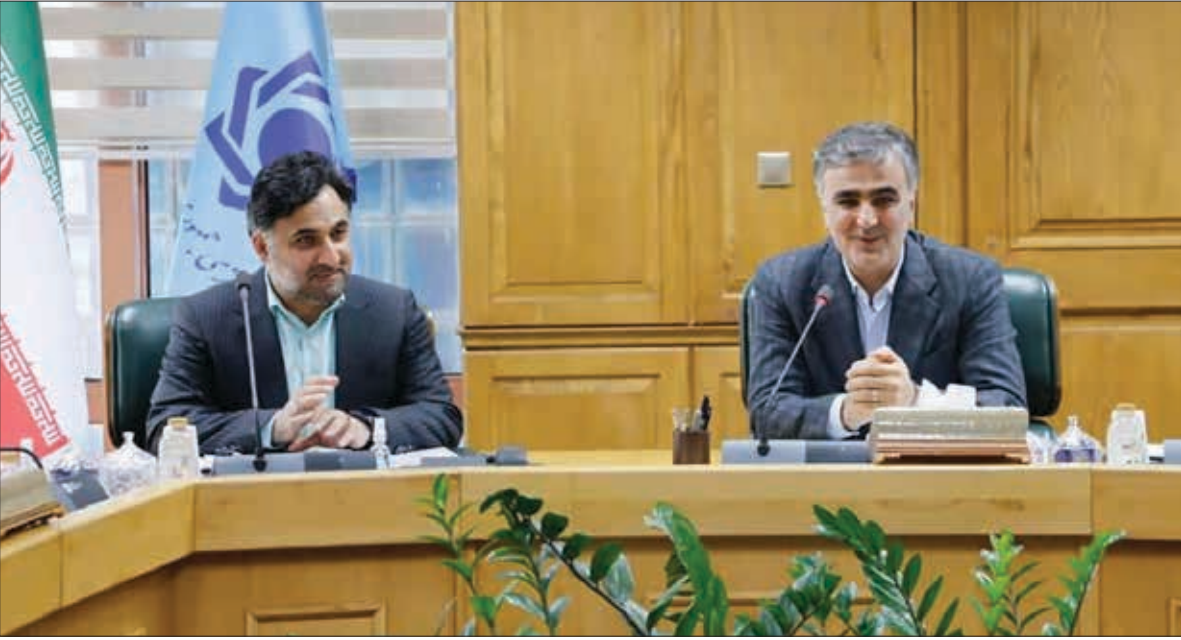
رئیس کل بانک مرکزی با مدیران اجرایی شرکت‌های دانش‌بنیان در جلسه‌ای در تهران.

خبرداد ر رئیس کل بانک مرکزی با اعلام افزایش اعطای تسهیلات ریالی به شرکت‌های دانش‌بنیان، از تخصیص خط اعتباری ۵۰۰ میلیون دلاری برای تأمین نیاز ارزی شرکت‌های دانش‌بنیان در سال جاری خبر داد. «محمد رضا فرزین» در دیدار و نشست معاون علمی و فناوری رئیس جمهور و جمعی از تشکل‌ها و شرکت‌های پیشرو در حوزه فعالیت‌های دانش‌بنیان با تأکید بر حمایت همه‌جانبه نظام بانکی از این شرکت‌های موثر گفت: به منظور حل مشکلات ارزی شرکت‌های دانش‌بنیان و در راستای حمایت عملی از آنان، خط اعتباری ۵۰۰ میلیون دلاری در سال جاری برای این بخش اختصاص می‌یابد.