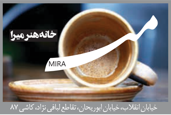
خیابان انقلاب، خیابان ایوریجان، تقاطع لیافی نژاد، کاشی ۸۷

رهبان معظم انقلاب در پیامی به مناسبت کنگره عظیم حج، آئین زندگی بخش جهانی بر پایه معنویت و اخلاق