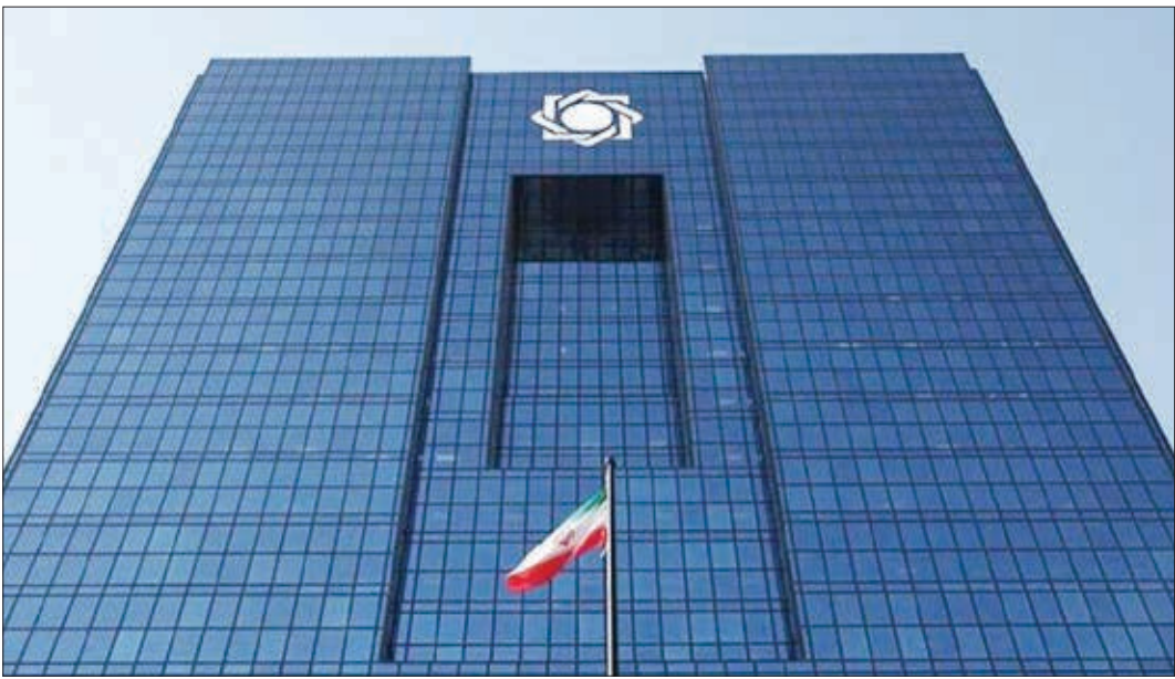
بانک مرکزی در تهران