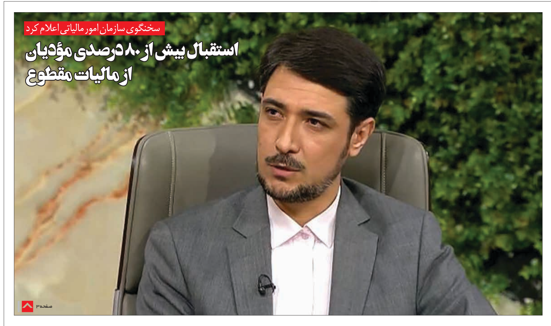
سخنگوی سازمان امور مالیاتی اعلام کرد

استقبال بیش از ۸۰ درصدی مؤدیان از مالیات مقطوع