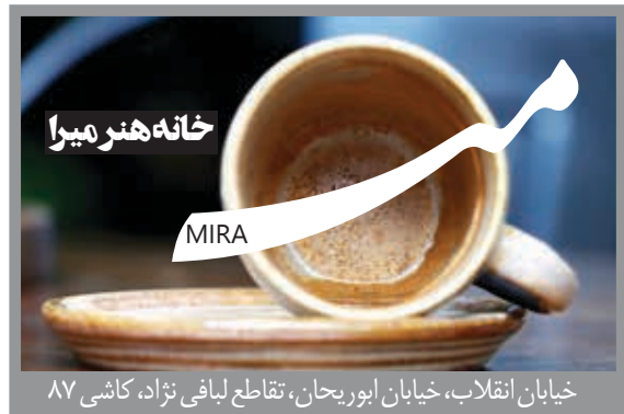
خیابان انقلاب، خیابان ایوریجان، تقاطع لیافی نژاد، کاشی ۸۷