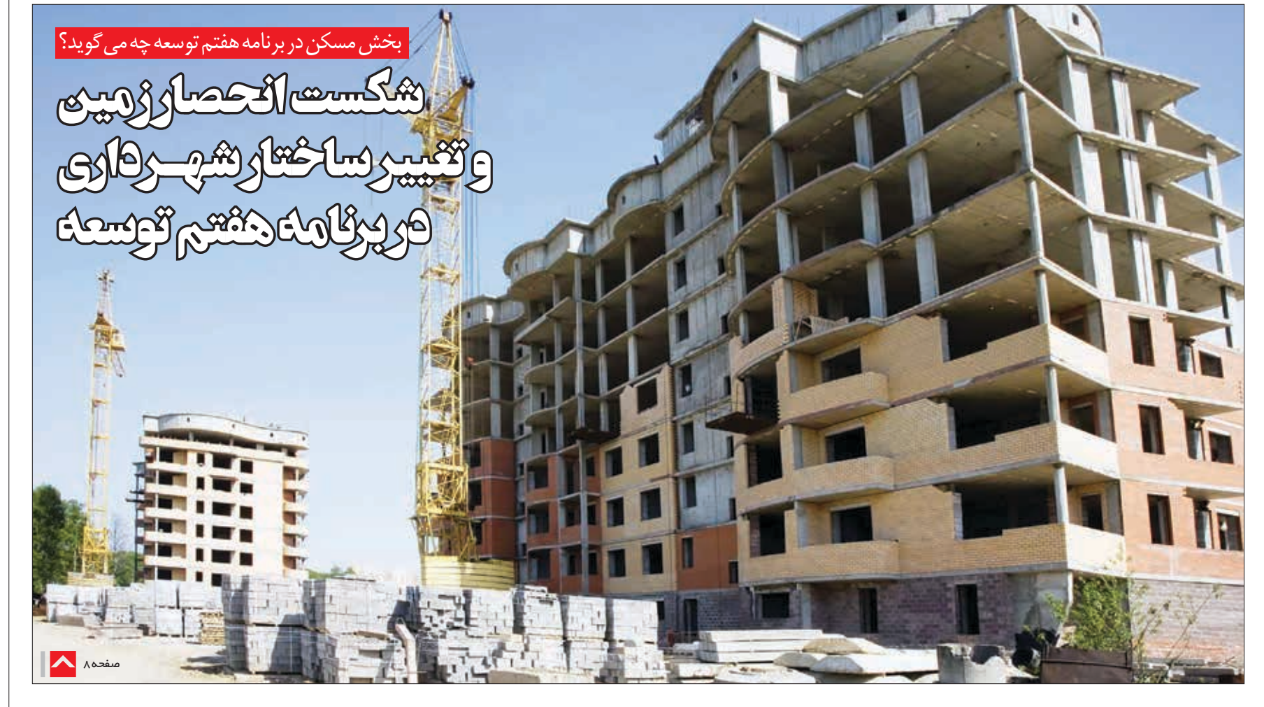
بخش مسکن در برنامه هفتم توسعه چه می‌گوید؟