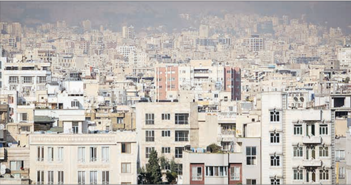
نمای کلی از یک منطقه مسکونی در تهران.