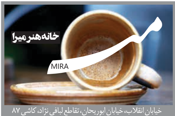
خیابان انقلاب، خیابان ایوریرجان، تقاطع لیافی نژاد، کاشی ۸۷