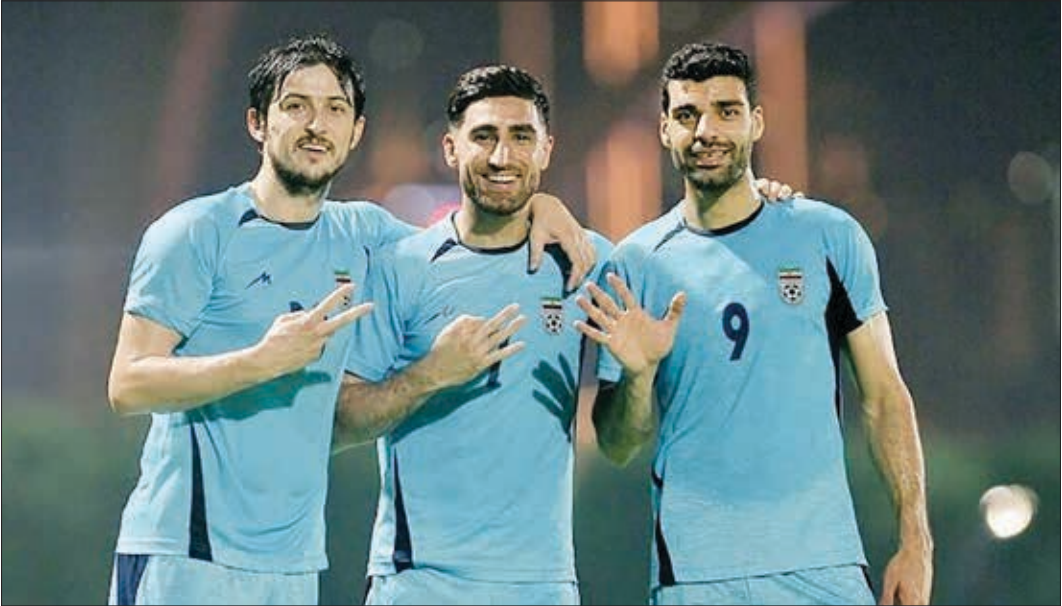
مهدی طارمی در جریان بازی با تیم ملی فوتبال ایران