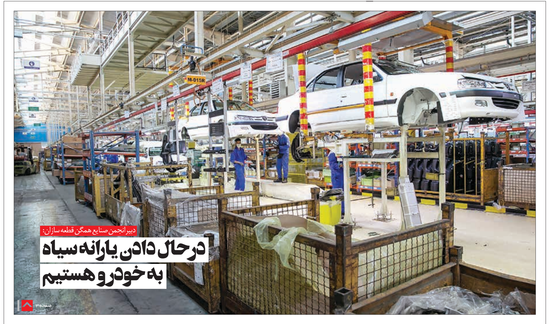
دبیر انجمن صنایع همگن قطعه سازان: