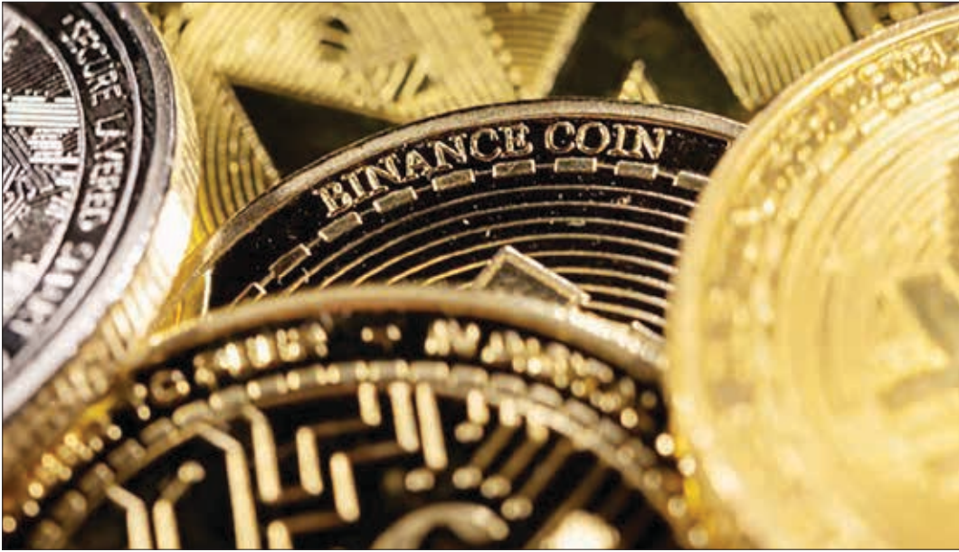
یک سکه طلا در کنار سکه‌های دیجیتال

همه این موارد در حالی است که به تازگی حسن هاشمی – رئیس سازمان نظام صنفی رایانه‌ای کشور– در گردهمایی فعالان صنعت فناوری اطلاعات و ارتباطات اعلام کرده‌است که هشت میلیارد دلار رمز ارز در کیف پول ایرانی‌ها وجود دارد اما مشکل کشور ما در این بخش، موضوع سیاست‌گذاری است نه منابع.از این رمز ارزها می‌توان برای واردات کالاهای اساسی استفاده‌شود و این مساله کمک بزرگی خواهد بود.