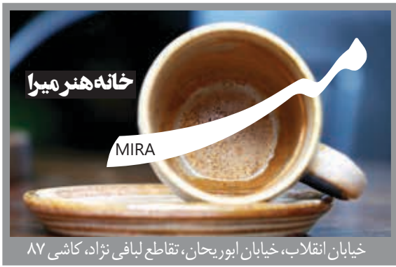
خیابان انقلاب، خیابان ایوریجان، تقاطع لیافی نژاد، کاشی ۸۷