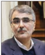
رئیس کل بانک مرکزی افزود: قصد داریم کلیه نیازهای واقعی مردم ایران به ارز را تأمین کنیم و نرخ کشف می‌شود نرخ بازار و نرخ مرجع برای قیمت گذاری خواهد بود.

محمدرضا فرزین در یک بخش خبری اظهار کرد: با توجه به نیاز مردم به اسکناس، در ۶۰ صرافی و ۱۵۰ شعبه بانک تلاش کردیم تمام نیازهای مردم به اسکناس تأمین شود؛ اما همانطور که قبلاً قلم دادیم مرکز جدیدی تحت عنوان مرکز مبادله ارز و طلا راه اندازی کرده ایم که فردا افتتاح می‌شود.