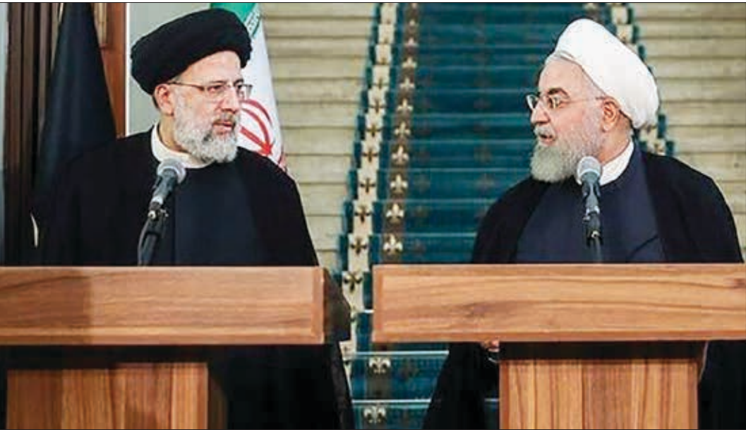
روحانی در جریان دیدار با رهبر انقلاب

غیرخوراکی هم از رشد ۵۳ درصدی قیمت برخوردار شدند.این امر نشان از افزایش فشار بر رسید هزینه‌ای خانوار است چرا که افزایش نرخ خوراکی‌ها فشار را بر سبد هزینه‌آنی افزایش می‌دهد.