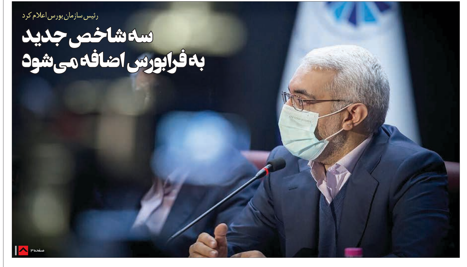
رئیس سازمان بورس اعلام کرد