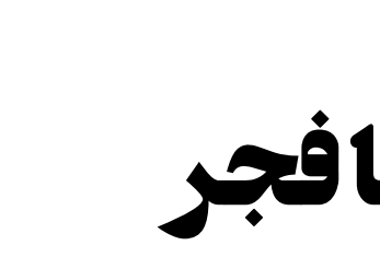
روزنامه اقتصادی صبح ایران