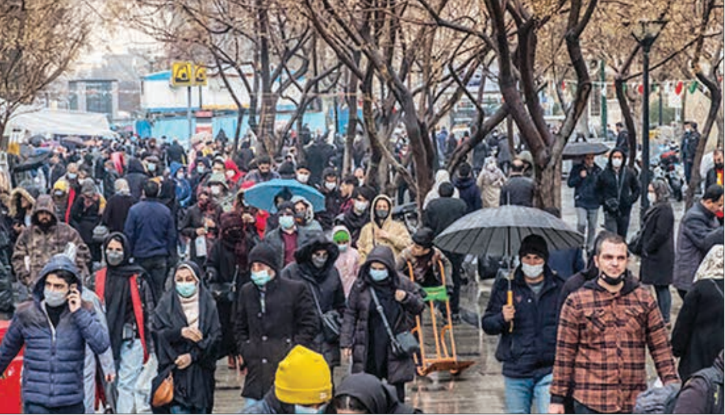
یکشنبه ۴ دی ۱۴۰۱ • شماره ۱۳۲۷