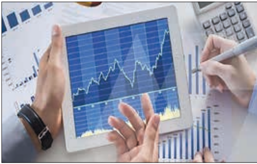
مید کو، شستا، پارس، شپنا، پارسیان و وغدیر شرکت های با بیشترین معوقه در واریز سود رسوبی هستند.

میزان واریز سودهای رسوبی سنوات گذشته سهامداران تا آخر ۱۲۴ آذر ماه به بیش از ۵ هزار و ۷۸ میلیارد تومان رسید. شرکت سپرده گذاری مرکزی اوراق بهادار و تسویه و جوهر (سمات) اعلام کرد: از ابتدای سال ۱۴۰۱ تا پایان ۲۴ آذر، ۲۴۷ شرکت بورسی، بیش از ۵ هزار ۷۸ میلیارد تومان سود رسوب کرده در حسابهای خود را از طریق سجام به حساب بیش از ۲۹ میلیون ۹۲۵ هزار سهامدار واریز کرده اند. شرکت های گلدیر با ۳۲ میلیارد تومان، پردیس با ۲۹.۱ میلیارد تومان و کاسپین با ۱۵.۵ میلیارد تومان، سه شرکت برتر هفته با بیشترین واریزی سود رسوبی به حساب سهامداران بوده اند.