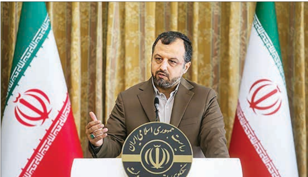
وزیر امور اقتصادی و دارایی در همایش تحول دیجیتال بانک و بیمه

در لایه نظرات، ما متأثر از فضای اقتصاد دیجیتال با فرصت‌های کم‌نظیری مواجه هستیم. سؤال این است؛ چرا سرعت تحولات در اقتصاد دیجیتال آن قدری که به فناوری به ما اجازه می‌دهد نیست؟ این مهم‌ترین مسئله است که باید در عرصه سیاست‌گذاری نگران آن بود. جامعه براساس نقطه عز یمت ۱۰ سال پیش ما را قضاوت نمی‌کند بلکه جایی است که امروز می‌توانیم باشیم و نخیشان انتظار دارند براساس شرایط ایده‌آل عمل کنیم. دستگاه‌های اجرایی در این زمینه کند عمل می‌کنند، حتی مسئولان نظام مالی