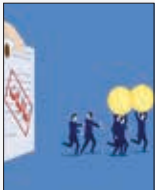
رییس سازمان امور مالیاتی

رییس سازمان امور مالیاتی در خصوص جزئیات احکام صادره گفت: متهم اول به تحمل دو سال و نیم حبس تعزیری بابت ارتکاب یازده مورد جعل اوراق و مهرهای شرکت‌های غیردولتی و تحمل دو سال و نیم حبس تعزیری بابت دو مورد معاونت در استفاده از اوراق مجعول شرکت‌های غیردولتی با قابلیت اجرای مجازات اشد، متهم دوم به تحمل دو سال حبس تعزیری بابت دو مورد استفاده از اسناد مجعول شرکت‌های غیردولتی و تحمل هفت ماه و نیم حبس تعزیری بابت چهار مورد معاونت در استفاده از اسناد مجعول با قابلیت اجرای