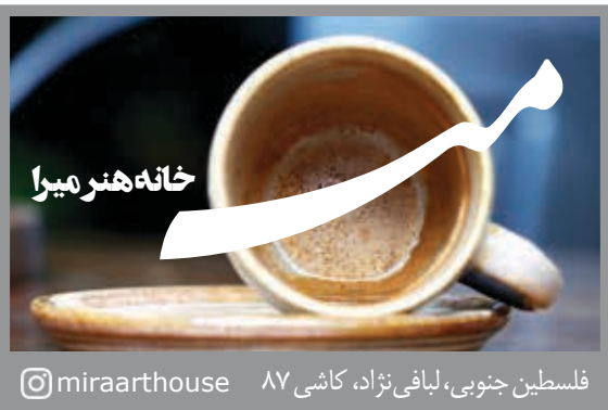
فلسطین جنوبی، لیافی نژاد، کاشی ۸۷ @miraarhouse

ضمن اینکه وزارت صمت در پاسخ به موارد مطرحه پیرامون افزایش قیمت