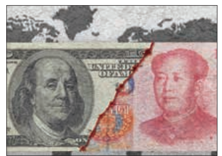
یوان به جای دلار