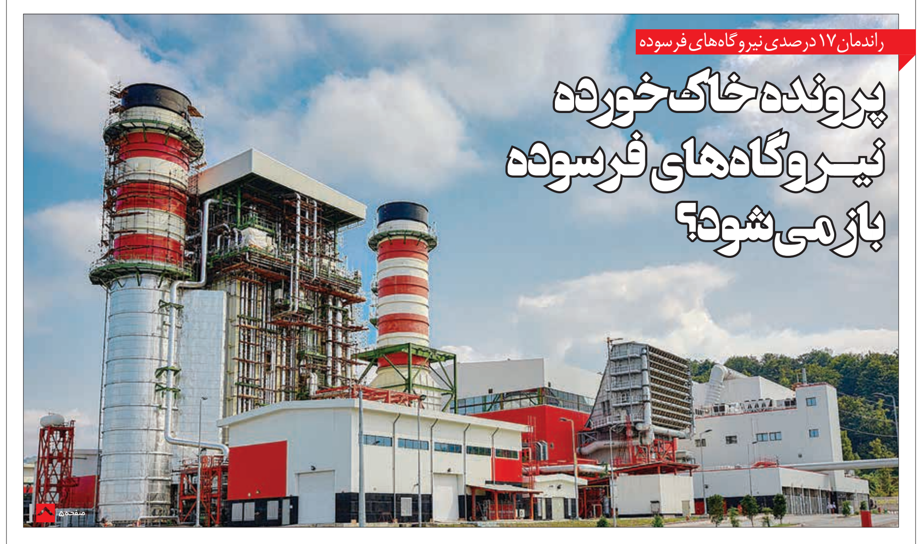
راندمنان ۱۷ درصدی نیروگاه های فرسوده