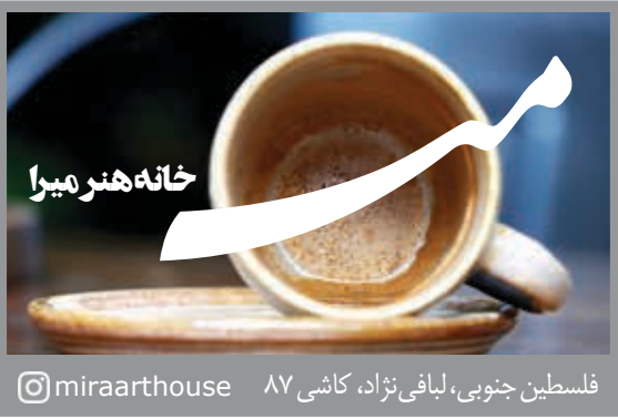
فلسطین جنوبی، لیبافی نژاد، کاشی ۸۷ @miraarhouse