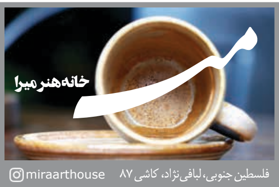
فلسطین جنوبی، لیافی نژاد، کاشی ۸۷ @miraarhouse

پایگاه خبری خبردار WWW.KHARIDAARONLINE.IR پایگاه تحلیلی خبر روز WWW.ROOZLINE.IR پایگاه هنری اجرارو WWW.EJRAARO.IR مارا دنبال کنید