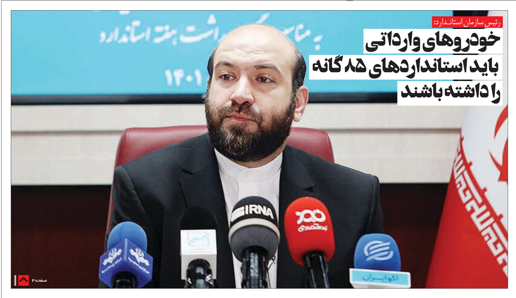
رئیس سازمان استاندارد: